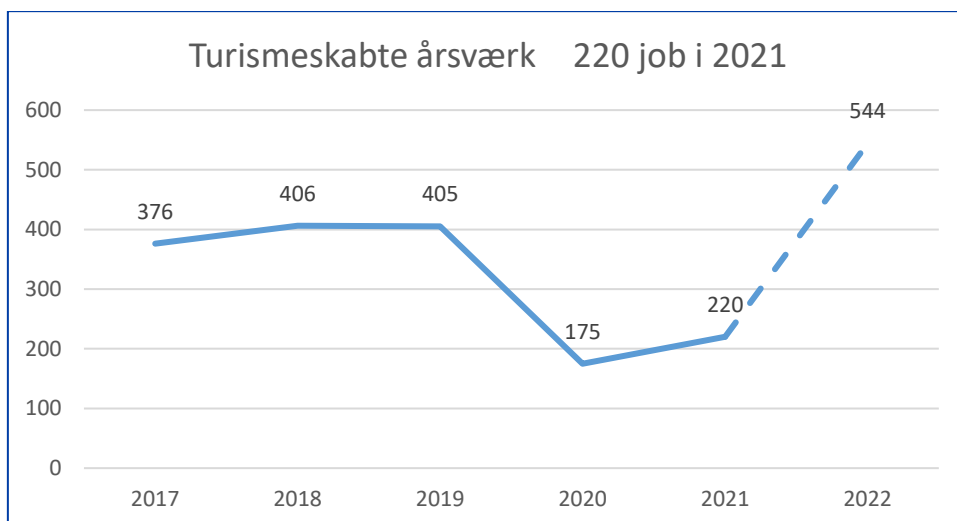
Figur: Turismeskabte årsværk i Dragør for perioden 2017-2021 og en fremskrivning for 2022

Kilde: Turisme økonomiske betydning i Wonderful Copenhagen, 2019 og 2021, VDK