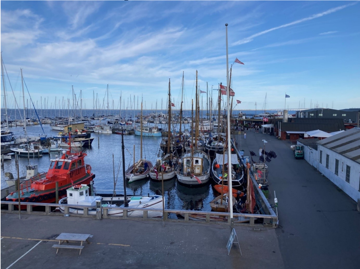
Træskibe i Gamle Havn i forbindelse med Skipperbyens dag 31. august 2024