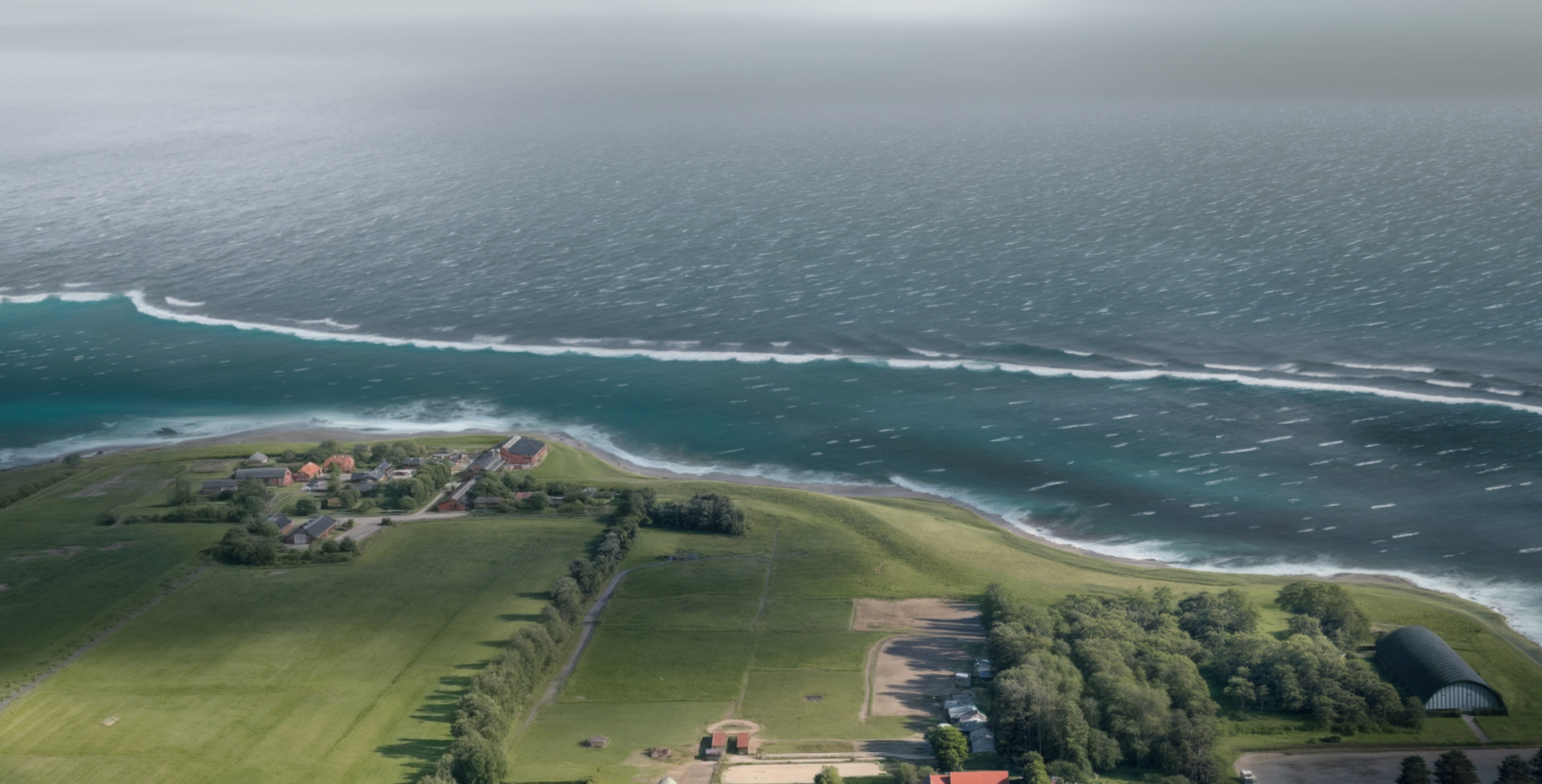
Visualisering fra Koføeds Enge under stormflodshændelse, ca. 5 år efter etablering