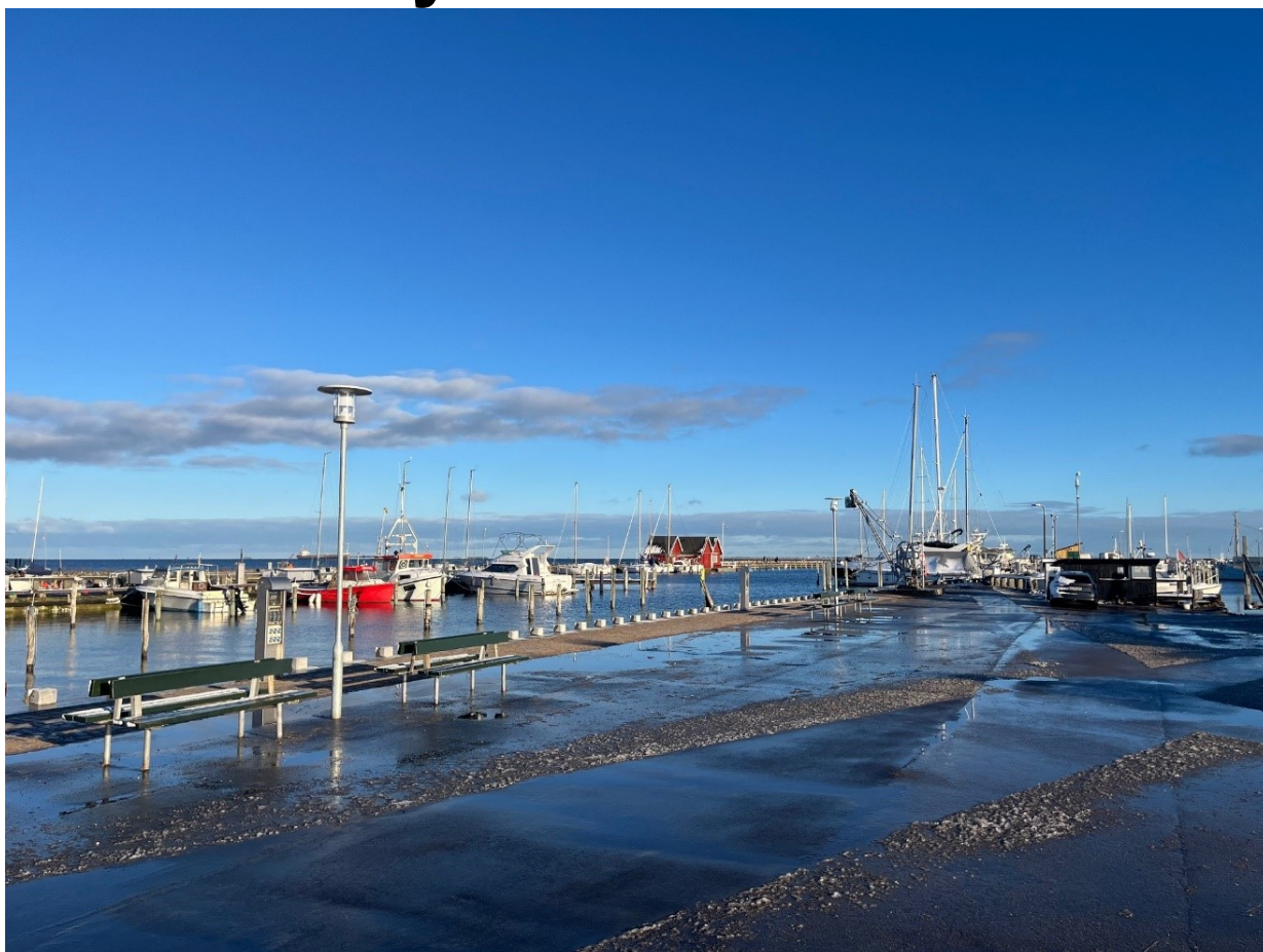
Beghusmolen i den lavt hængende vintersol